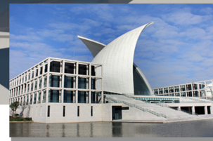
A.P. Møllers Maritime Museum med maritime konferencecenter