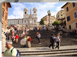
Trappe til Torvet "Den Grønne Kile"