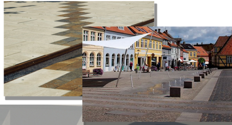
Overrisling fra Dronningemeaen og Kobberbækken