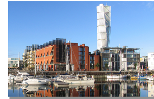
Højhus/skyskraber Svendborgs nye varetegn