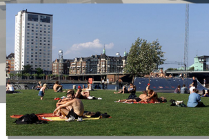
A.P. Møller Havnepark: Bænke, petanque baner, plæner mv.