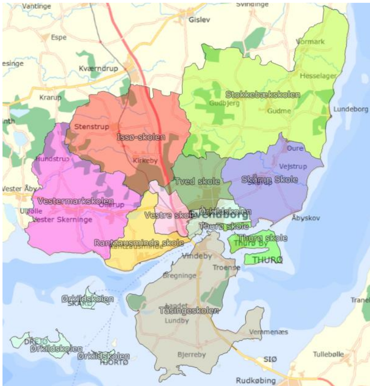
Kort over skoledistrikter