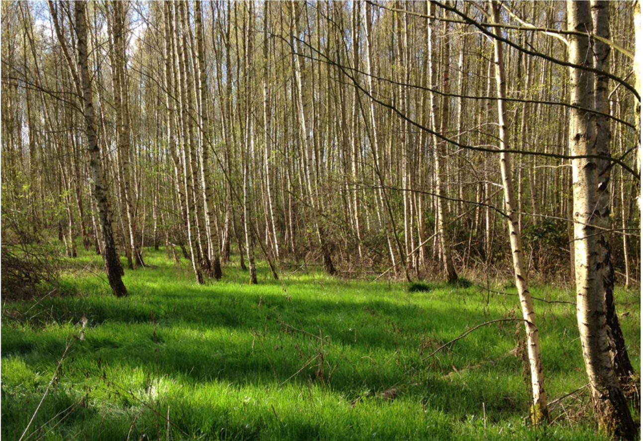
Parcel i Juulgårdskoven med selvsåede birketræer, foto inden udtynding i 2022

Der er i 2022 gennemført udtynding af unge løvtræsbevoksninger i Juulgårdskoven, Poulinelund og Hallindskoven. Hugsten er udført som strukturhugst, dvs. uensartet udtyndning, der på sigt gavner variation og biodiversitet i skoven.