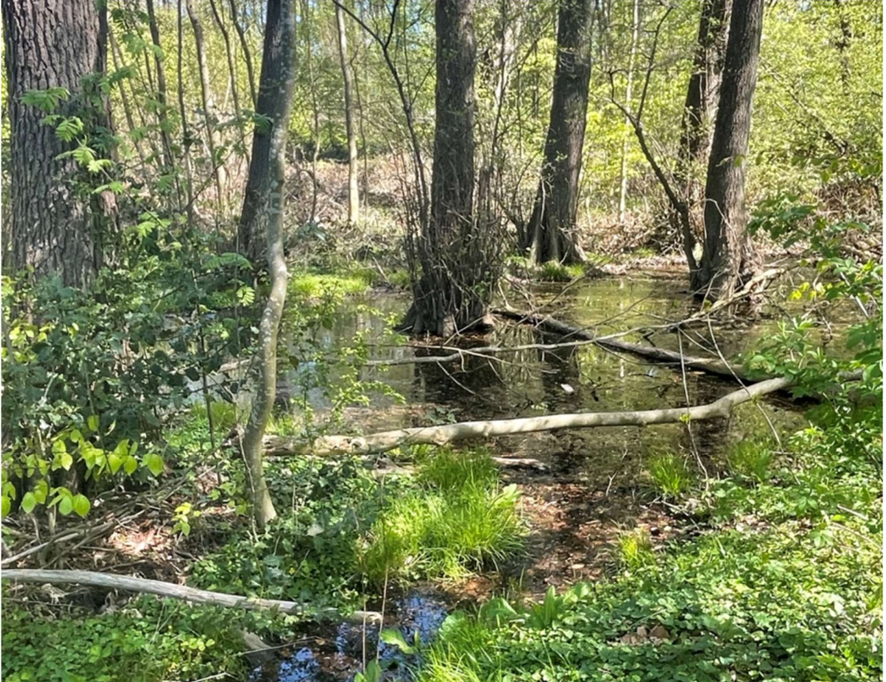
Ellesump i Tyveskoven

Der er registreret 122 nøglebiotoper i kommunens skove. Nøglebiotoper er områder, der er vigtige for bevarelse af den biologiske værdi i skoven. De omfatter bl. a. søer, ellesumpe, enge, stendiger, overdrev, vandløb samt levesteder for særlige dyre- og plantearter.