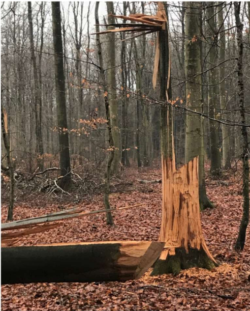
Ringede bøgetræer i Sofielundskoven