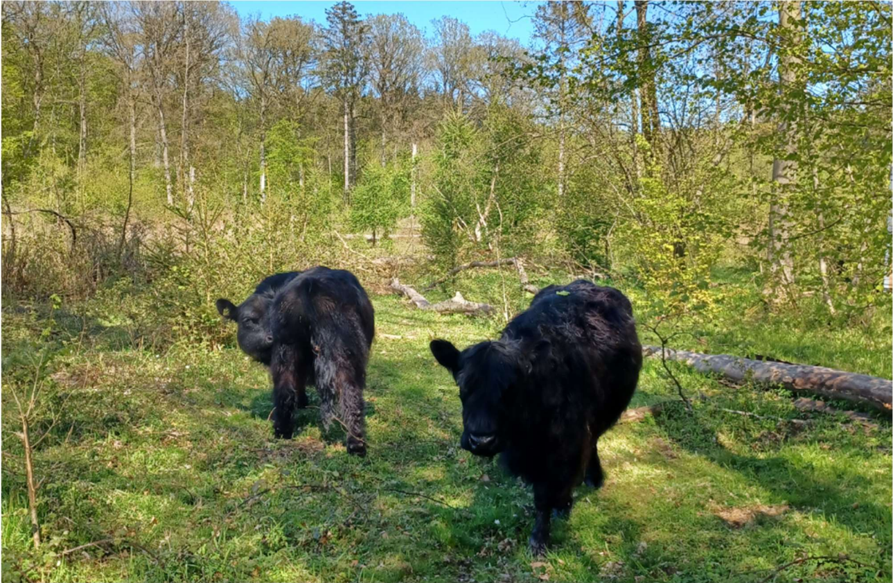
Skovgræsning i Sofielund