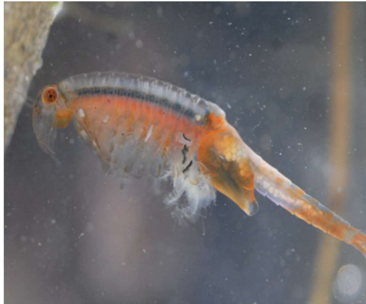
Den sjældne forårs-ferreje

I Sofielundskoven er det undersøgt, hvordan livsbetingelserne i de mange små vandhuller i skoven kan forbedres. Her lever bl.a. den sjældne forårs-ferreje.