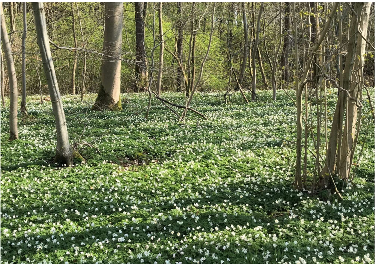
Den klassiske bøgeskov med anemoner.

I forbindelse med Skovstrategien og forvaltningsplanerne er alle kommunens skove blevet digitaliseret med tilhørende skovkort. Det er muligt at finde kommunens skove på kommunens kort: https://www.svendborg.dk/borger/park-vej-og-trafik/park-skov-og-strand