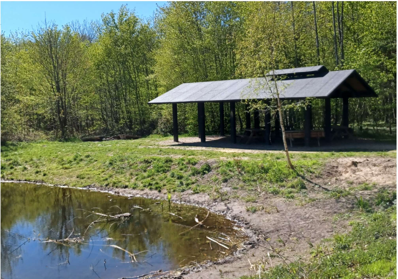
Bålhytten i Sofielundskoven, vandhullet blev rensset op i 2022

Mange skoler og institutioner har brugt skoven og madpakkehuset som udflugtsmål, og shelterne blev booket ca. 75 gange i 2022.