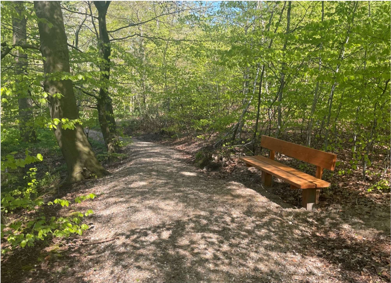
Ny skovsti i Tyveskoven