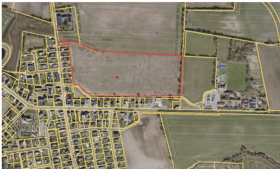
Figur 1: Projektets placering markeret med rødt.

Der er søgt om at etablere projektet på matrikel 12a1, Kirkeby By, Kirkeby, der er vist på figur 1.