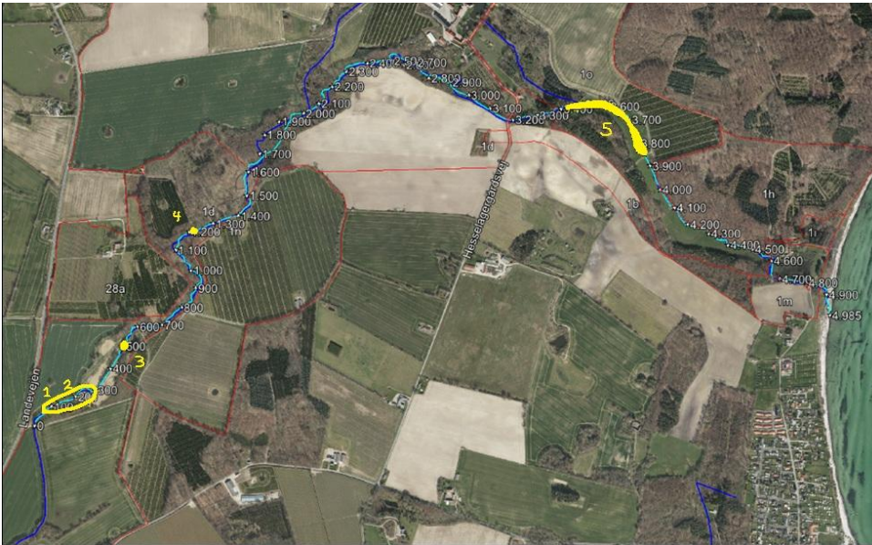
Figur 2: Visuel oversigt over projektet med markeret placering af tiltag 1-5.