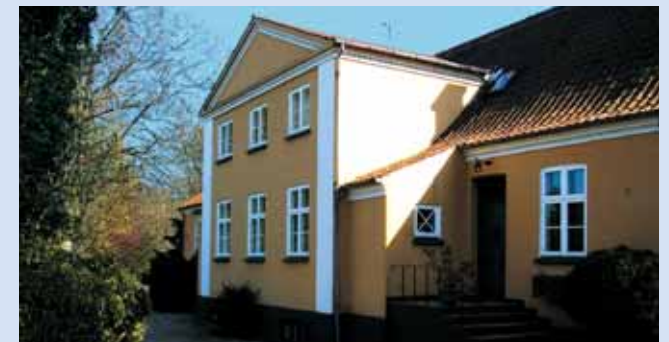
Klædefabrikken – nu privatbolig

I udkanten af Troense by fører stien dig ind gennem Kohaveskoven, som løber langs med Valdemars Slot. Her kan du se de formodede rester efter Troenses tidligere klædefabrik, hvor over 100 spindere og vævere i 1700-tallet var i sving med at omdanne råvarer som hør, uld og importeret bomuld til brugbart klæde. Fabrikken var et tidligt forsøg på at skabe industriel virksomhed på basis af husflid, og igangsætteren var atter Niels Juel, der med egne midler og penge fra staten kunne indkalde ekspertise fra Tyskland. Den nuværende bygning har siden været såvel skovrider- som præstebolig.