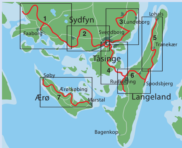
Oversigt over Øhavsstiens forløb med angivelse af de 7 folderkort som udgives i forbindelse med stien

Øhavsstien bliver en af Danmarks længste vandrerruter med omkring 200 km. Stien er lavet for vandrere og forløber således kun undtagelsesvist på asfalterede veje. Når stien i løbet af 2007 bliver færdiggjort, vil den omkranse Det sydfynske Øhav.