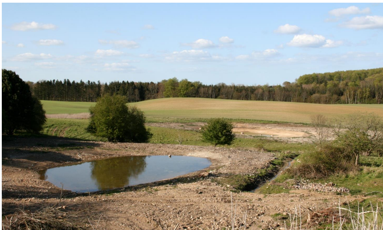
To af de nye vandhuller, der er etableret for klokkefrø, Lundeberg.

For at undgå forurening af kalkoverdrev og klokkefrøvandhuller er flugtskydningsbanen ved Klintholm herudover aftalt flyttet til anden placering i løbet af 2016.