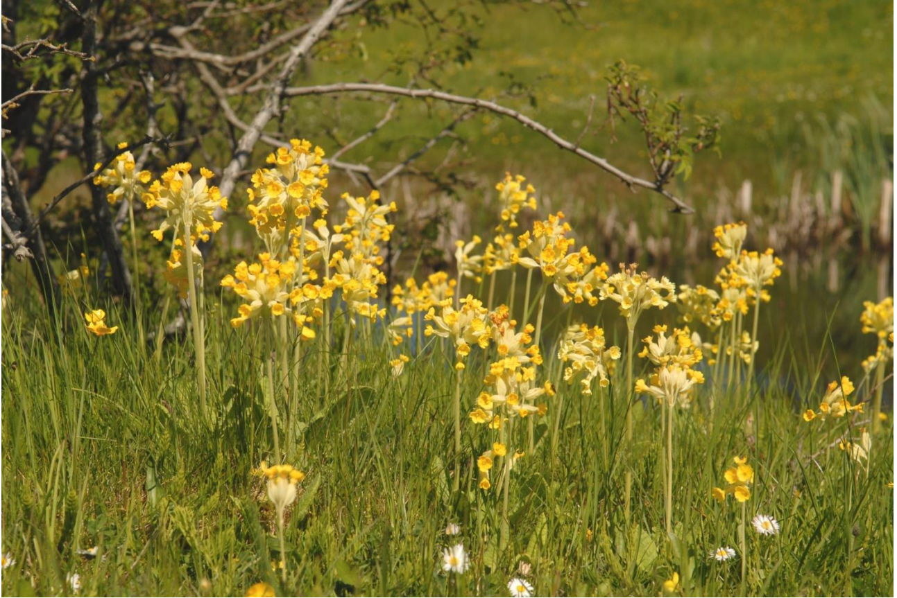
Områdets kalkrige overdrev rummer en rig flora. Hulkravet kodriver.