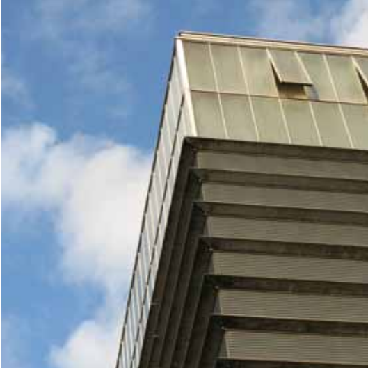
Udsnit af Svendborg Kraftvarmeværk