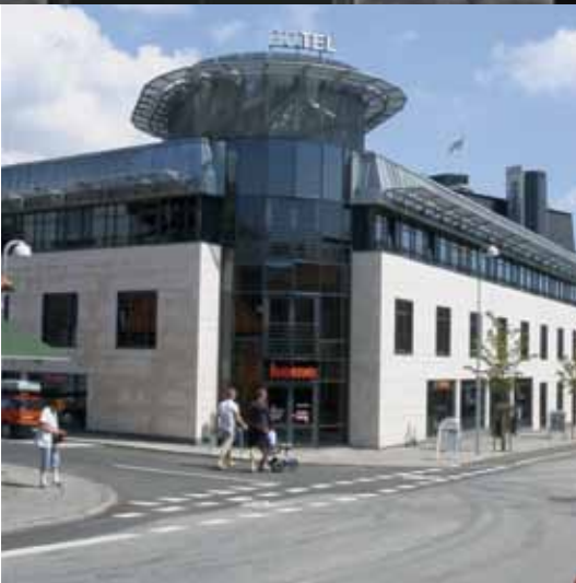
Hotel Svendborg, Tinghusgade