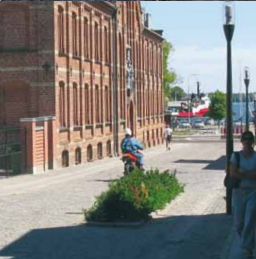
Sundkig langs Sct. Knuds Kirke, Havnegade

Svendborg har som den første danske kommune opnået medlemskab af det internationale Cittaslow-byenetværk. Cittaslow udspringer af en ide om 'det gode liv' og handler om livskvalitet og om at 'skynde sig langsomt'. Det er fokus og fordybelse frem for stress og jag. Cittaslow bruger moderne og teknologiske løsninger på en kreativ måde med afsæt i de lokale særpræg, traditioner og historie. Fra det lokale orienterer man sig mod det globale og fremtiden på et bæredygtigt grundlag. Cittaslow er udvikling med udsyn og omtanke.