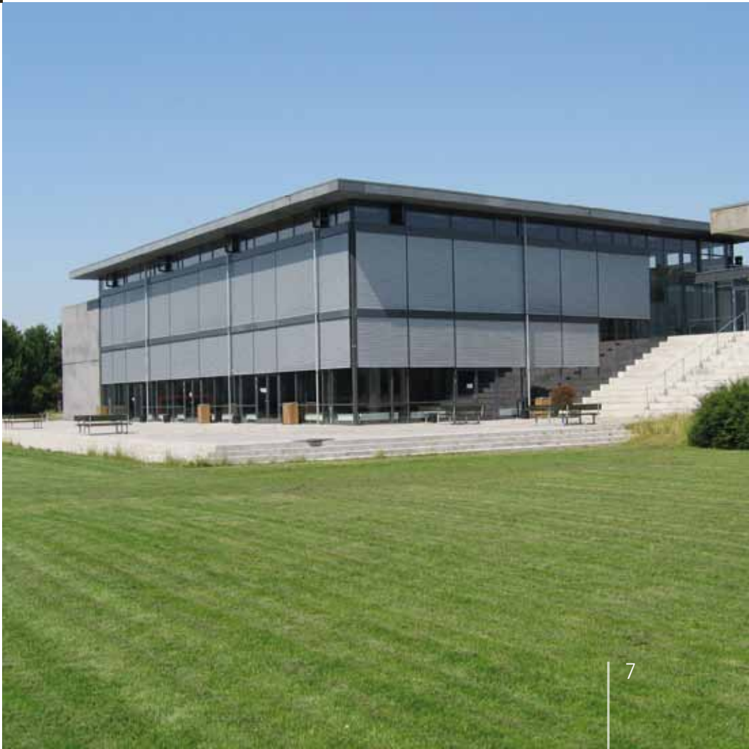
Svendborg Gymnasium, Det Boglige Hus