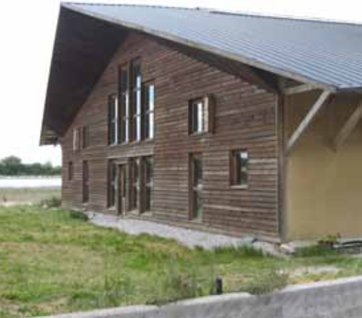
Moderne Landbrugsbyggeri, Søren Lolksvej, Tåsinge