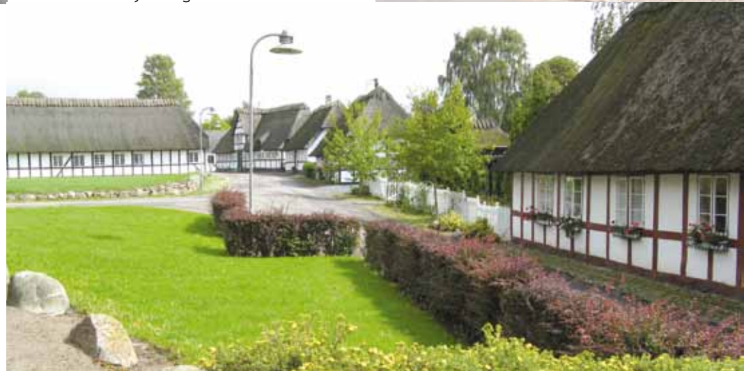
Landsbymiljø, Vester Skerninge