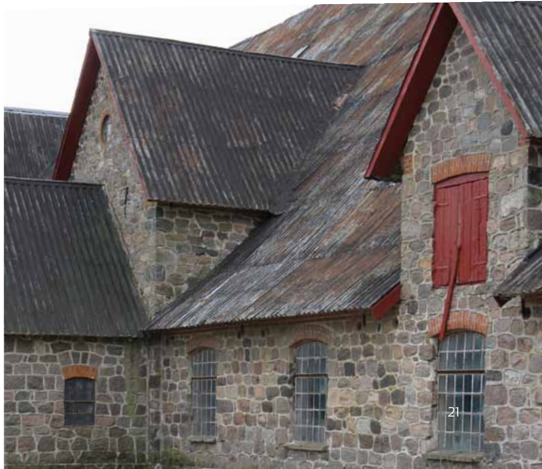
Landbrugsbygning ved Skjoldmose, Stenstrup