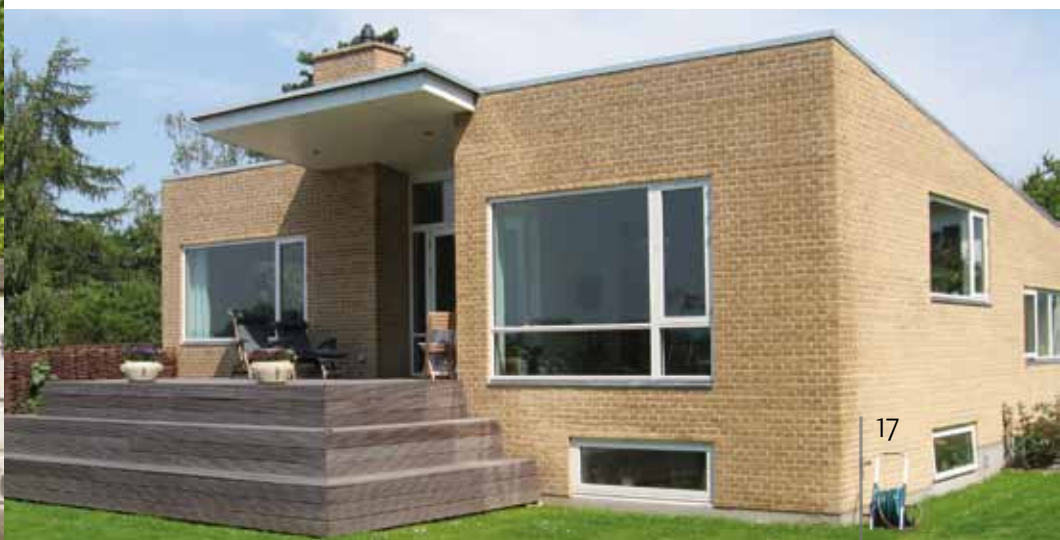
Villa på Myrehøjvej