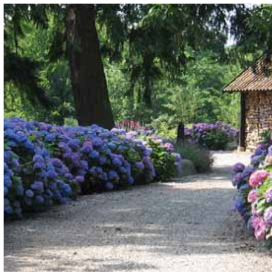
Privat indkørsel, Christiansminde