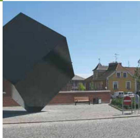
Byrum omkring Tervingen, Møllergade og Havnegade

Med kommuneplanen og lokalplaner kan vi medvirke til at skabe gode rammer for arkitekturen. Lokalplanerne er vores redskab til at sikre bevaringsværdige bymiljøer og til at fastlægge karakteren af nye områder. En visionær planlægning er et godt instrument til at udtrykke intentioner og til at sikre kvalitet i både planer, byrum, arkitektur og materialer. Der ligger en stor opgave i at finde den rette balance mellem det nye, vi gerne vil have, og det eksisterende, vi ikke vil undvære.