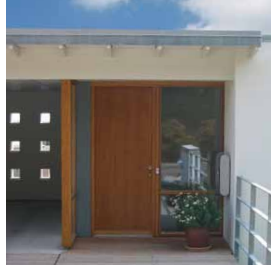
Indgang til Villa på Enemærket