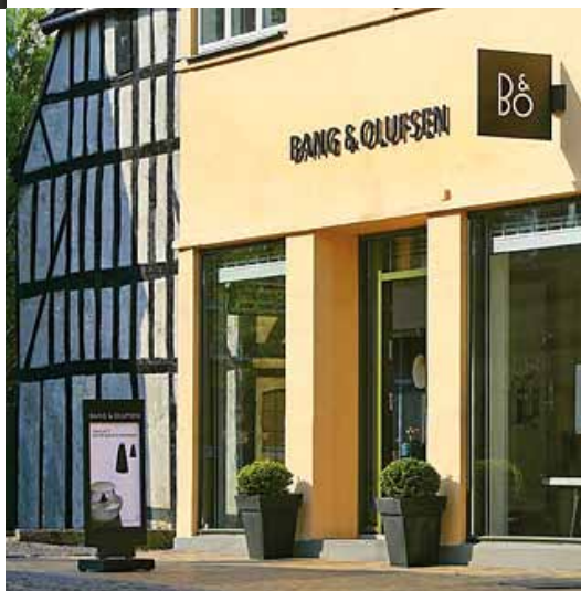
Byens historiske udvikling afspejlet i gadebilledet, Gåsestræde