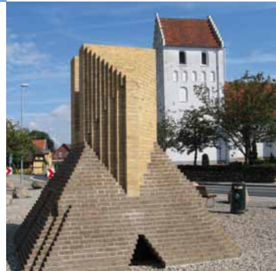
Stenstrup Torv med middelalder kirke