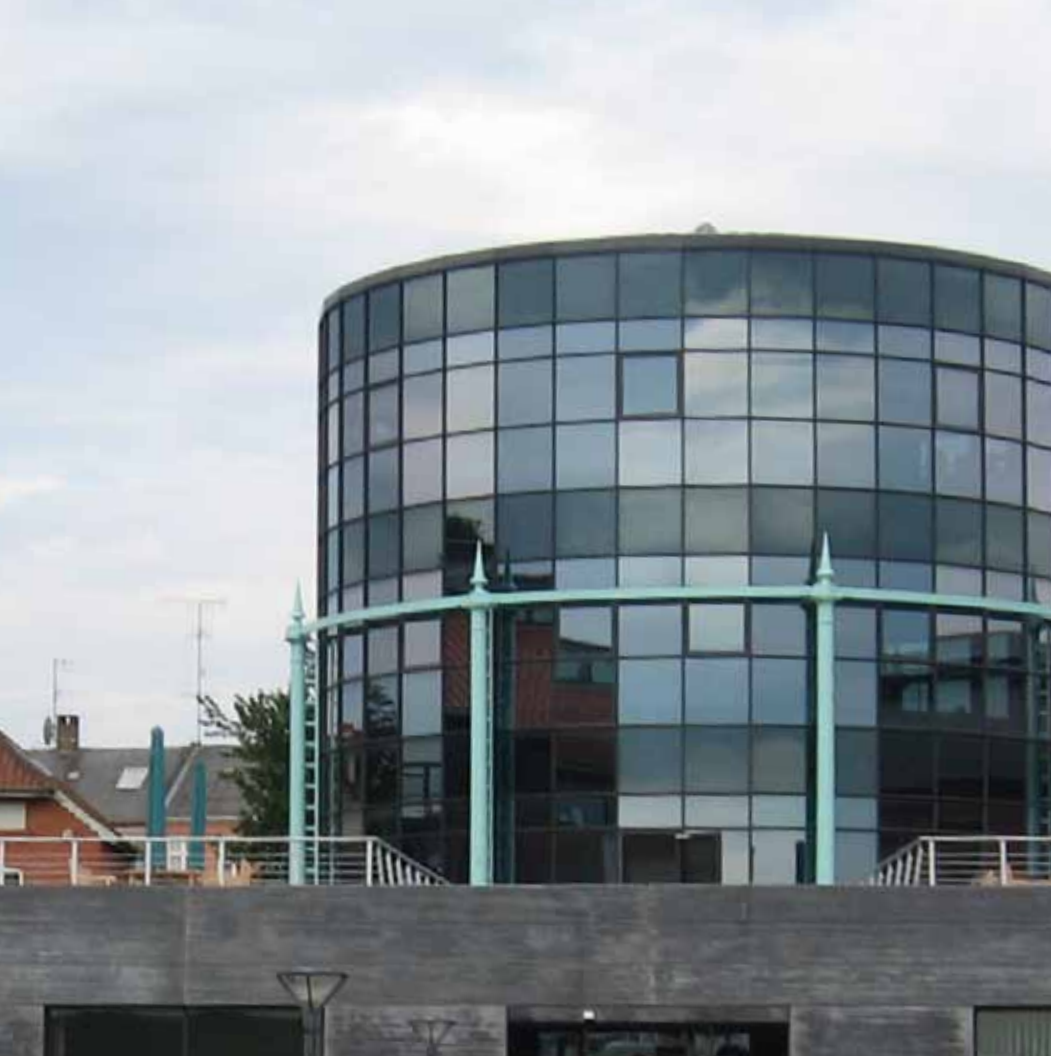
Forskerparkens rotunde i Kullinggade