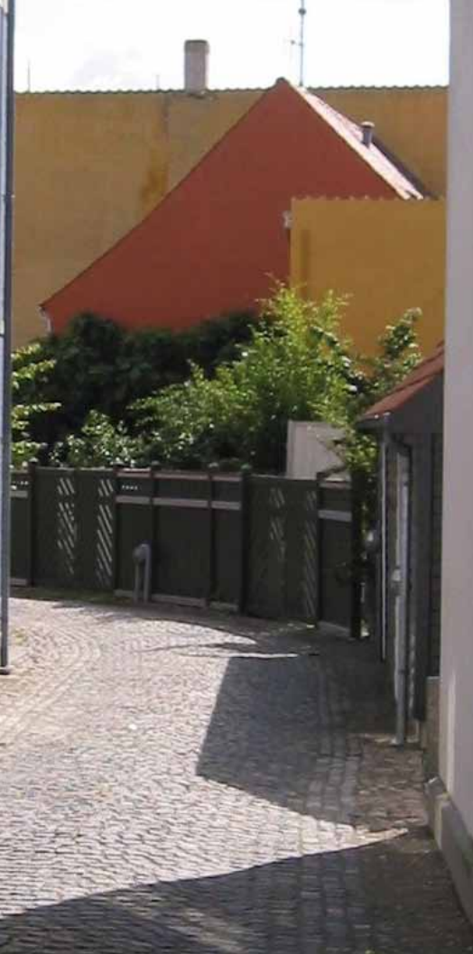
Roligt gadeforløb med afstemte farver, Skt. Peders Stræde