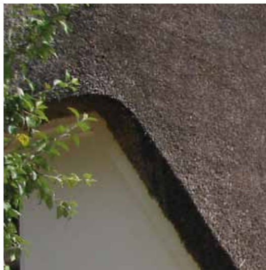
Detalje, bevaringsværdigt hus

Arkitektonisk kvalitet er ikke et statisk begreb, men skal vurderes i forhold til sin tid og sine forudsætninger. Arkitekturpolitikken skal ikke opsætte endegyldige facitlister for den arkitektoniske kvalitet, men inspirere og motivere alle til at tænke sig om. Vi skal vælge kvalitet.