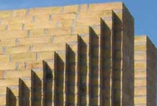
Detalje omkring teglstensanlæg, Stenstrup