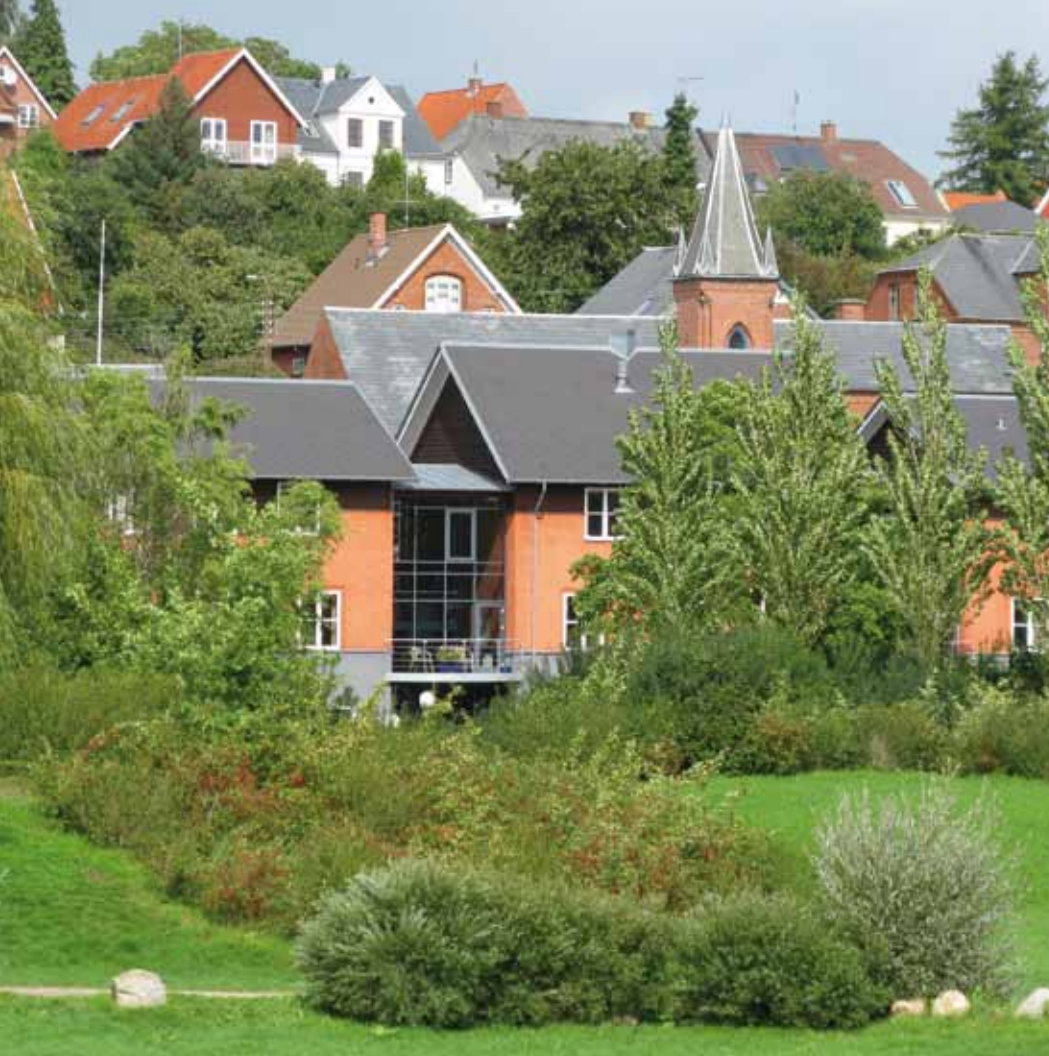
Naturen i byen, Naturlegepladsen ved Dronningemaen