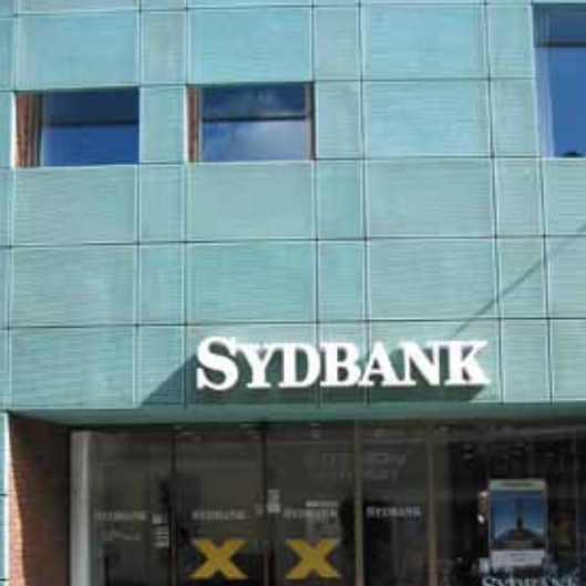
Nænsom skiltning, Brogade