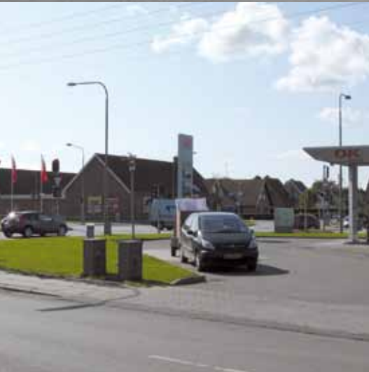
Centerområde ved Sundhøj og Vindebycentret