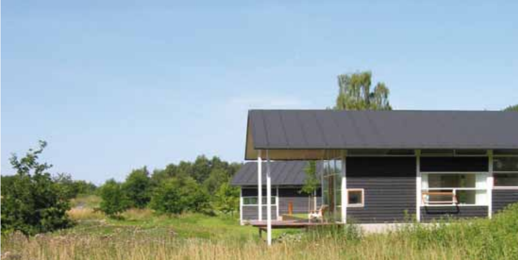
Privat villa, Tåsinge