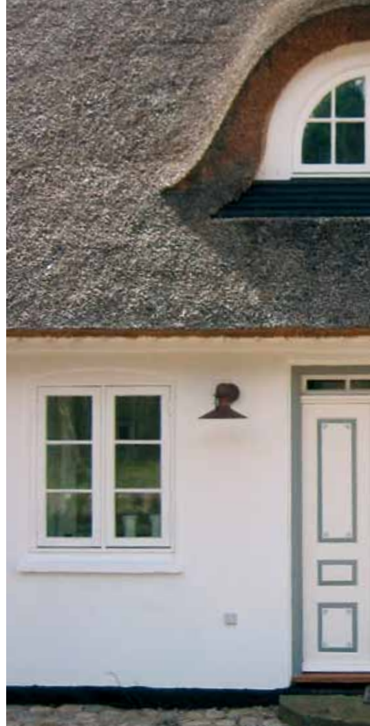
Bevaringsværdigt hus, Tåsinge